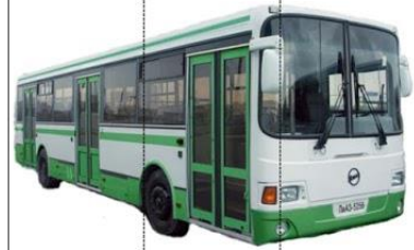
au to bus