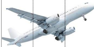
sa mo lot