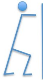
rozcąganie łydki 5x10 sekund

Stajemy naprzeciwko ściany. Ręce wyprostowane opieramy o ścianę. Ustawiamy się tak jakbyśmy odpychali się od ściany wysuwając jedną nogę do tyłu utrzymując przy tym linię prostą nóg i tułowia. Drugą nogę pozostawiamy ugiętą z przodu w wykroku. Pozostajemy w takiej pozycji 10 sekund i zmieniamy stronę. Powtarzamy 5 razy na prawą i 5 razy na lewą stronę.