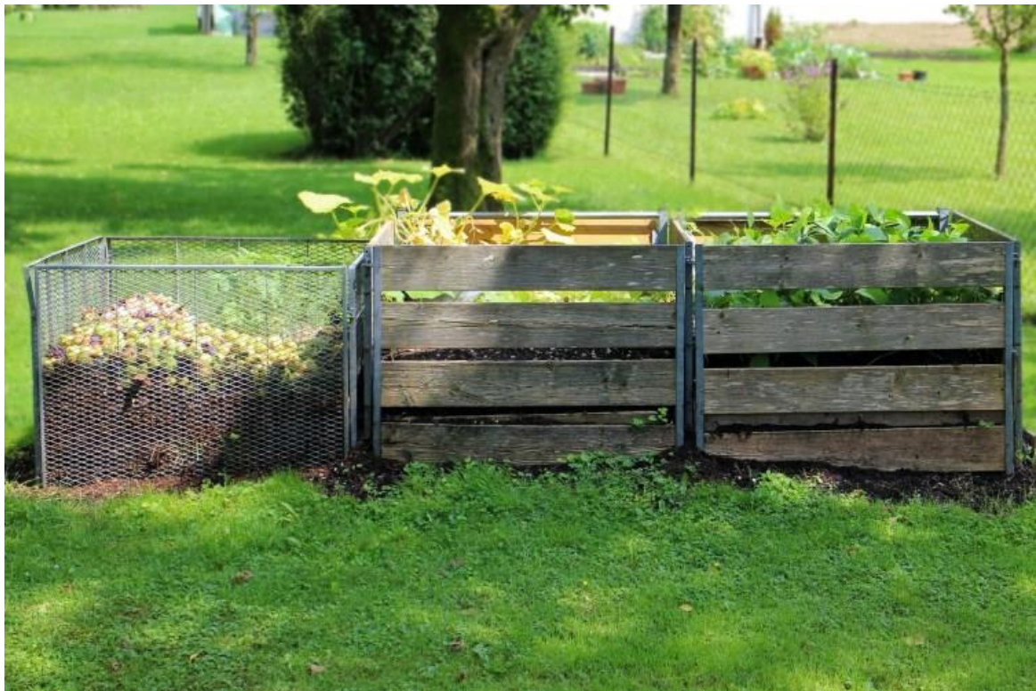
Kompostownik w ogrodzie/na działce