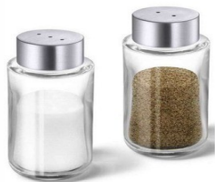
sól i pieprz