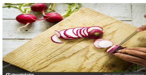
rzodkiewkę kroimy drobno