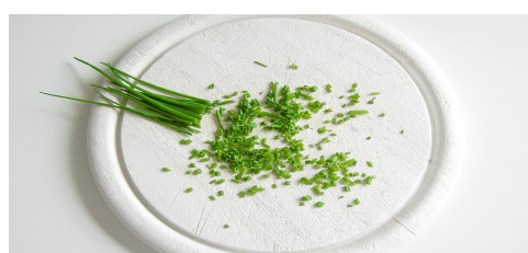
szczypior siekmy drobno