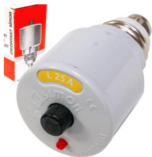
Rysunek 2 Bezpiecznik automatyczny wkręcany