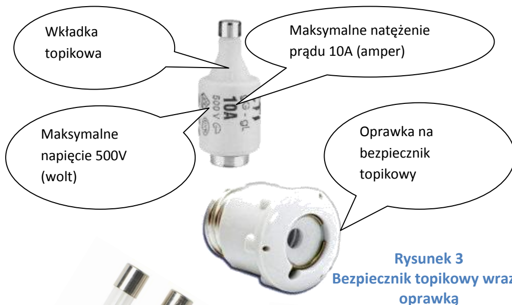
Rysunek 3 Bezpiecznik topikowy wraz z oprawką

Działanie bezpiecznika topikowego polega na przetopieniu się drutu topikowego i przerwanie w ten sposób przepływu prądu.