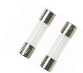
Rysunek 4 Bezpieczniki topikowe stosowane w urządzeniach elektrycznych