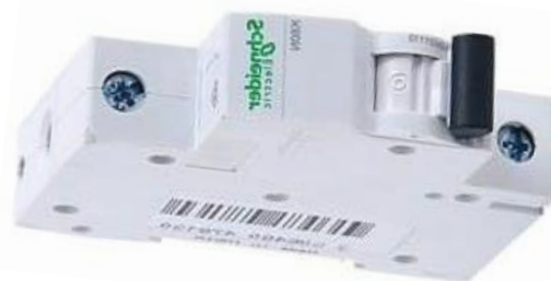
Rysunek 5 Wyłącznik nadprądowy bezpiecznik