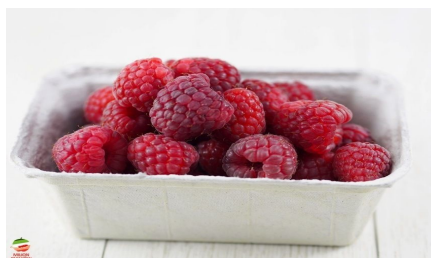
2 garści malin