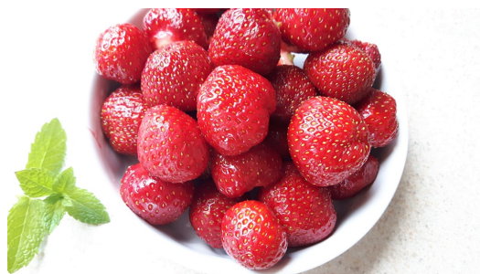
2 garści truskawek