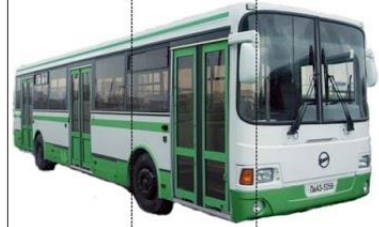
au to bus