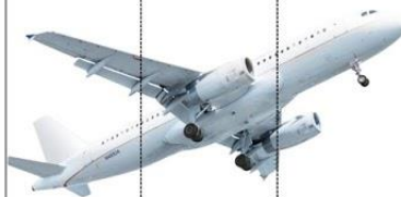
sa mo lot