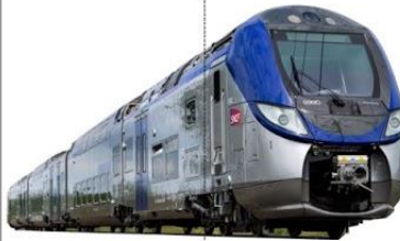
po cią g