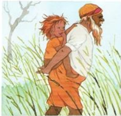
Oto dziadek Aborygen ze swym wnuczkiem.

Aborygeni uważani są za pierwszych mieszkańców Australii. Żyją z myślistwa, łowiectwa i zbieractwa.