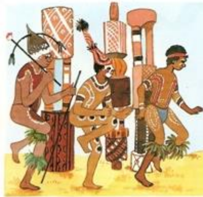
Aborygeni tańczą wokół świętych pali.