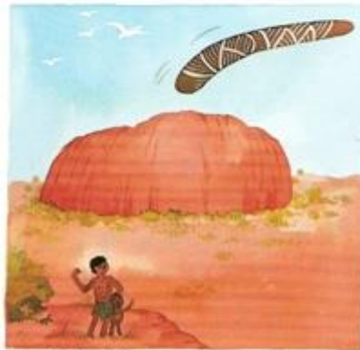
Dzieci ćwiczą rzuty bumerangiem.