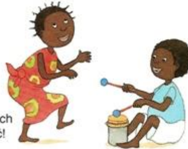
Przymocuj korale na końcach ołówków. Możesz zaczynać!