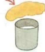
Napnij skórę na puszcze.