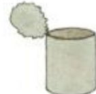
puszkę po konserwie