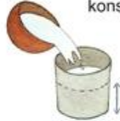
Wlej wodę do puszki, ale nie do pełna.