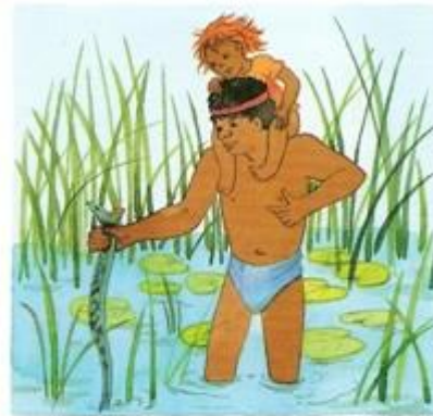
Aborygen chwyta węża. Potem go upiecze i zje.