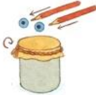
Obwiąż ją sznurkiem wokół puszki.