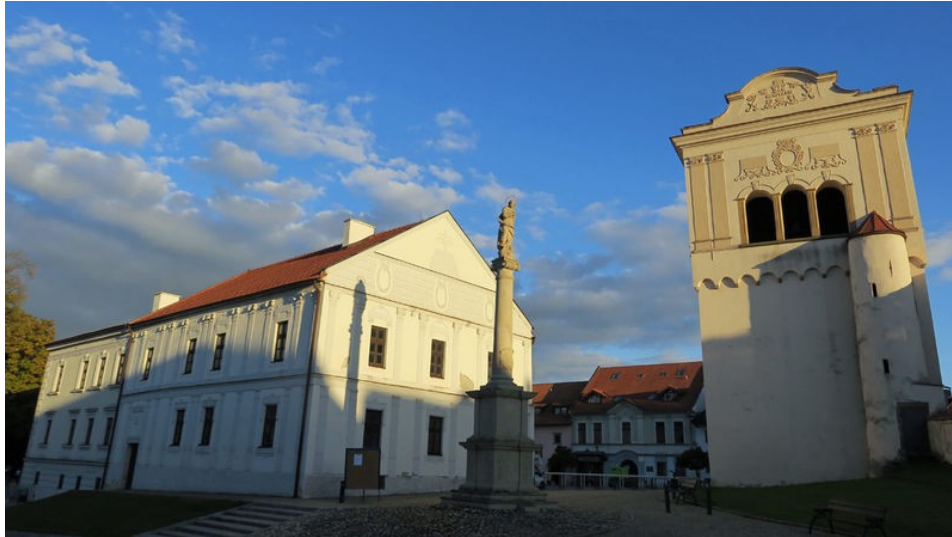
Zabytkowa Spiska Sobota (kampanila) - Poprad, Słowacja