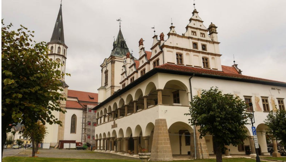
Stare Miasto w Lewoczy

Większość zabytków skupia się w ścisłym centrum. Zobaczymy tu przede wszystkim gotycki kościół św. Jakuba ze słynnym średniowiecznym ołtarzem wykonanym przez Mistrza Pawła z Lewoczy. Osobie tego wybitnego architekta poświęcone jest muzeum, które wraz z innymi placówkami tworzy tzw. Muzeum Spiskie (SNM-Spišské múzeum). Za wybitne dzieło architektury renesansowej uznawany jest tutejszy ratusz, obok którego zachował się pręgierz w formie tzw. klatki hańby. Warto zajrzeć też do barokowych kościołów minorytów (nowy i stary). Całość opasują dobrze zachowane mury obronne wraz z bramami: Koszycką i Polską.