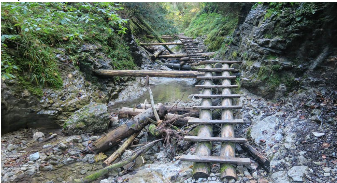
Drewniane kładki w wąwozie Sucha Bela (Słowacki Raj)

Słowacki Raj to jedno z najczęściej odwiedzanych miejsc na terenie całego kraju. Nie ma się co dziwić, świetnie wytyczone szlaki o różnym stopniu trudności prowadzą turystów po drabinach, równoważniach, przez wąwozy i nad wodami rwącej rzeki. W samym centrum współczesnego parku narodowego mieścił się niegdyś średniowieczny klasztor (według legend to od niego pochodzi nazwa całego obszaru), dziś po tamtych zabudowaniach pozostały jedynie malowniczo położone ruiny.