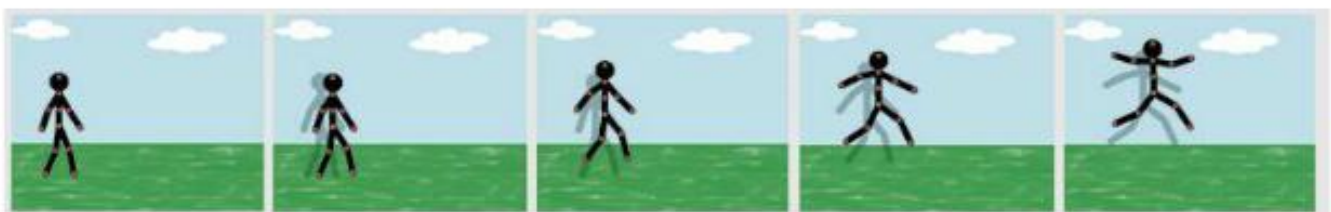
Rys. 9. Pierwsze klatki animacji przedstawiającej cieszącego się patyczaka

Zmieniaj nieznacznie położenie odpowiednich części postaci i dodawaj kolejne klatki (rys. 9). Podczas pracy odtwarzaj co pewien czas animację, aby sprawdzić, czy dodane klatki są wykonane poprawnie. Jeśli się pomylisz, możesz usunąć wybraną klatkę – wystarczy kliknąć prawym przyciskiem myszy w jej podgląd na górze okna, a następnie wybrać Usuń ✖ z podręcznego menu.