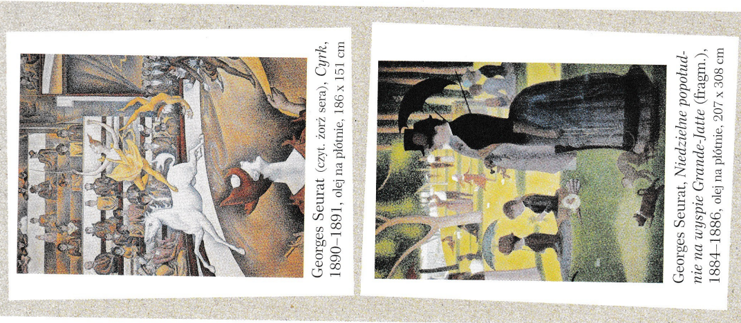
Georges Seurat (czyt. żorż sera), Cyrk , 1890–1891, olej na płótnie, 186 x 151 cm

Pokoloruj rysunek za pomocą trzech kredek: czerwonej, żółtej i niebieskiej. Nie używaj kresek, niech twój obrazek składa się z samych punktów.