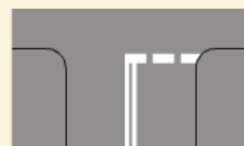
Linia warunkowego zatrzymania złożona z prostokątów