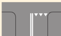
Linia warunkowego zatrzymania złożona z trójkątów