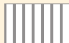
Przejście dla pieszych