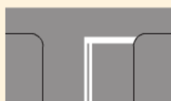
Linia bezwzględnego zatrzymania – stop