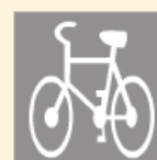
Rower (droga dla rowerów)