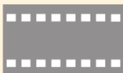
Przejazd dla rowerzystów